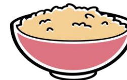
玄米ご飯 (140g) 0.2mg