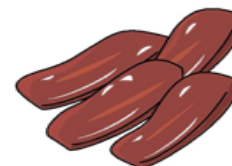
豚レバー (100g) 0.34mg