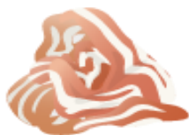
豚こま切 (100g) 0.66mg