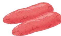
たらこ (50g) 0.4mg